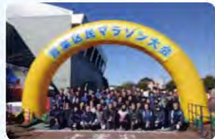
最後は大会アンバサダーの有森裕子さんと記念撮影