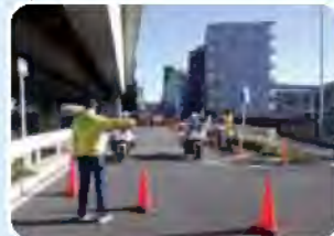
安全確保のため、コース誘導・警備を行うとともに、観客や歩行者、車両の整理・案内を行いました。