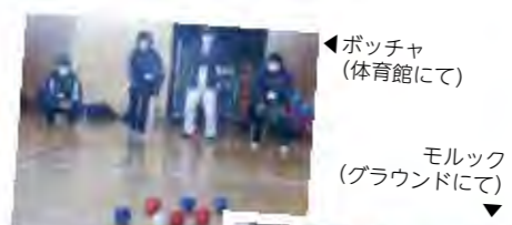
◀ポッチャ(体育館にて)