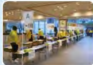
当日は7時に集合。今年も青少年指導員がランナーの受付を行いました。