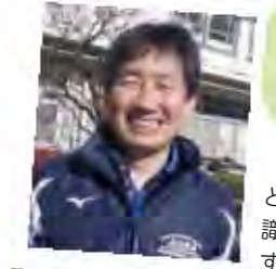
モルック(グラウンドにて)