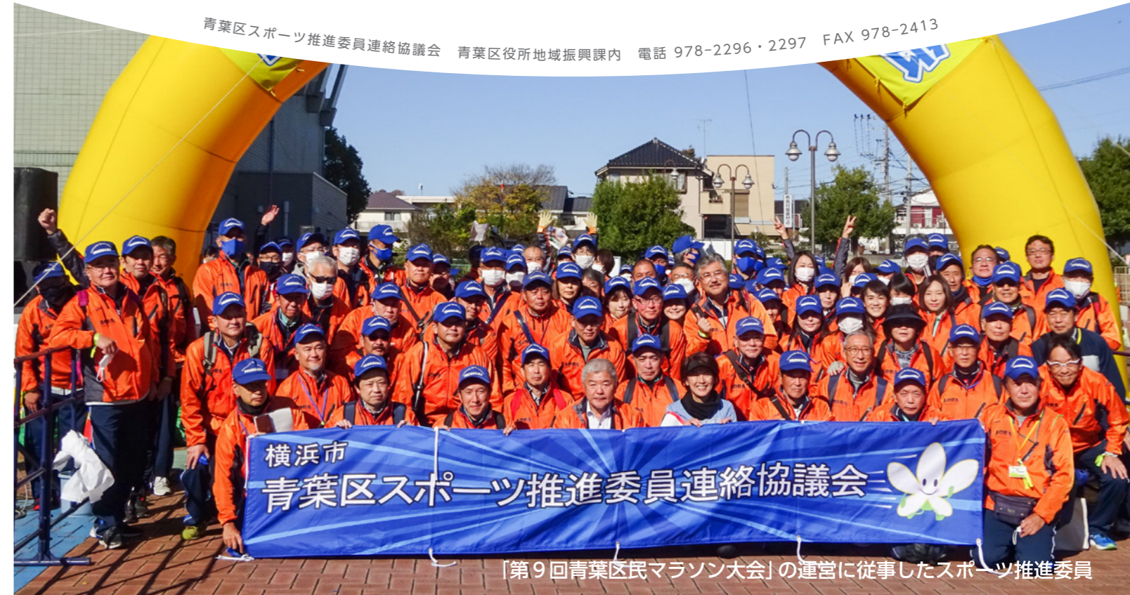
「第9回青葉区民マラソン大会」の運営に従事したスポーツ推進委員

青葉区スポーツ推進委員連絡協議会 青葉区役所地域振興課内 電話 978-2296・2297 FAX 978-2413