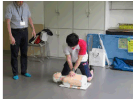
「ラグビーワールドカップイベント/講習会・体験会」