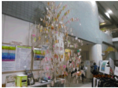
「七夕～短冊に願いを」