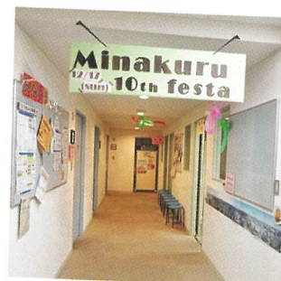
みなくる 10周年フェスタ