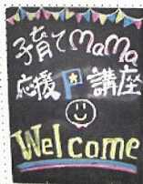
子育てママ 応援講座