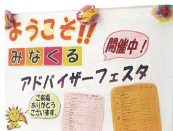
みなくるアドバイザー フェスタ