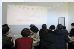
第4講 みなまきラボ