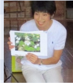
あきこマミさん 「親子であそぼう リトミック」 @上白根大池公園 こどもログハウス