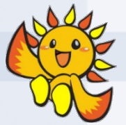
旭区マスコットキャラクター 「あさひくん」