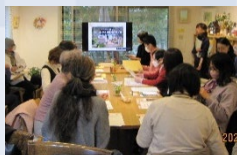
第2講 ハートフル・ポート