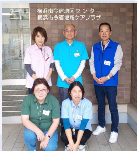
横浜市今宿地区センター 横浜市今宿地域ケアプラザ

2001年7月22日に開館して22年経ちますが、旭区内の地区センターでは比較的新しい地区センターになります。閑静な住宅地の中にあり地域の皆さまの「憩いの場」として親しまれています。