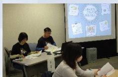
第3講 しおんカフェ