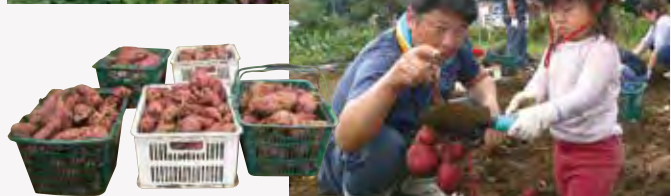
令和元年9月収穫祭(サツマイモ)