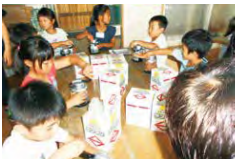
防災訓練で手回しランタンを試す子どもたち

6自治会町内会の防災意識の向上のため、毎年度防災マニュアルを作成し、地域住民約4千世帯に配布するとともに、地域防災拠点での訓練等で活用してきました。補助金交付は今年度で終了となりますが、次年度以降は防災拠点通信を発行するなど、形を変えながら防災・減災の取組を継続していく予定です。