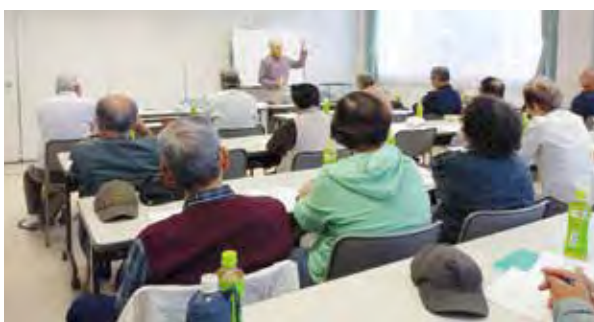
ホタルの飼育について学びました

「中堀川プロムナード」を花と緑のいこいの場にするため、清掃活動や花植えを行っています。プロムナードに地域の小学生の絵を飾ることで、地域の人々の関心を集める場所となっています。ホタルの復活のため、「ホタルの飼育講習会」を開催し、春の放流を目指して幼虫飼育も始まりました。