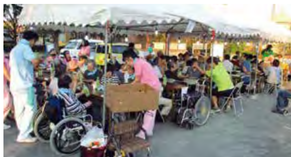
施設利用者が町内会の夏祭りで住民と交流しました

町内の高齢者施設、障害者施設等と連携を深めて発災時のいざという時に事故のない体制づくりを進めています。今年度は、夏の町内イベントの開催時に、防災訓練を兼ねて各施設の利用者を招待するなど、地域住民との交流も図りました。今後も定期的に続けていく予定です。