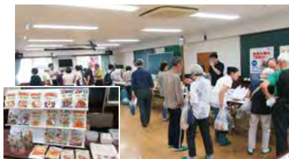
防災訓練で防災備品展示と非常食の試食会を行いました

若葉台二丁目南地区自主防災本部は、地区独自の防災避難訓練を実施するなど、住民の防災や自助・共助に対する意識の向上に取り組んでいます。今年度は、防災マニュアルの作成や防災ニュースの発行のほか、住民の「災害時緊急対応情報」の収集を進め、収集した情報を災害時の緊急対応に役立てられるよう整備を行いました。