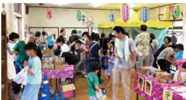
キッズ縁日にたくさんの家族が訪れました

ふれあいサロンや、キッズ縁日などの親子で楽しめる行事等を通して自治会内の交流を深め、互いの顔が見える関係作りに取り組んでいます。また、災害時の援護についてアンケートを実施し、援護希望者へのフラワーポット配布や、黄色いハンカチで安否確認訓練を行うなど、近隣相互の共助活動を行っています。