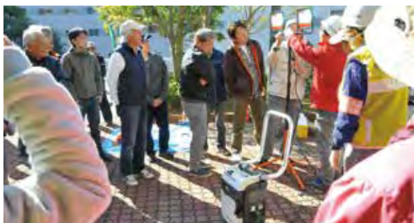
LED投光器を実際に使ってみました

自治会・管理組合と連携して防災体制の整備を進めています。今年度も新たに購入したLED照明器具・救護担架を使った防災訓練を実施しました。今後も防災訓練等を通じて住民の防災意識の向上と発災時に支え合う関係づくりを目指して活動を推進します。