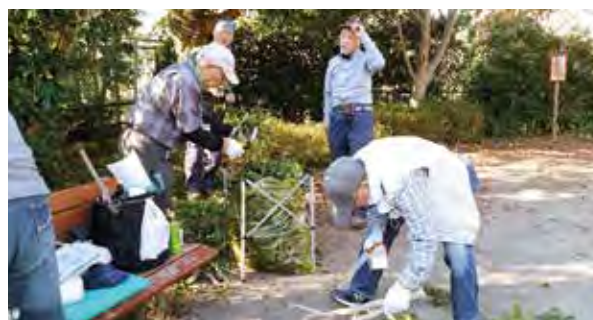
庭木剪定の講習会を実施しました

お手伝い内容は、庭仕事や買い物・掃除のほか、ごみ出しや家具の組み立てなど多岐にわたっています。