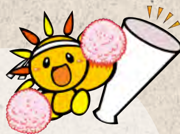
旭区マスコットキャラクター 「あさひくん」