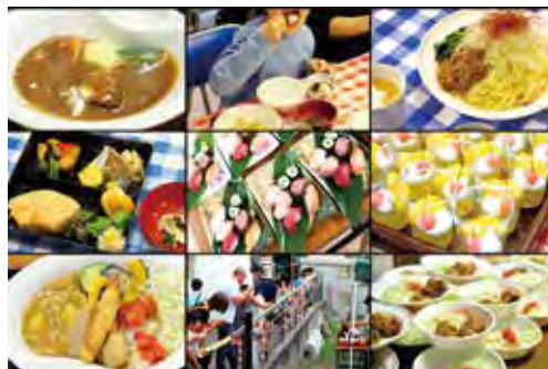
季節を感じられるバラエティ豊かなメニューを提供

「美味しいものを食べると笑顔になる」をモットーに、孤食の子どもや、ひきこもりがちな高齢者、子育て中の方にも季節感を大事にした美味しい料理を、おなか一杯食べてもらいます。「こども食堂」と、高齢者向けの「かがやき食堂」を開催して住民同士の交流を深め、地域のみなさんの笑顔が増えるよう活動しています。