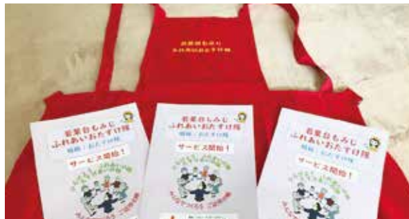
おそろいのスタッフエプロンを作りました

高齢者や身体の不自由な方、子育て世代等で、日常生活の支援が必要な方々のちょっとした困りごとを支援し、地域のご近所同士が支えあい、助けあえるまちづくりをめざします。支援が必要な人には会員になってもらい、状態を把握して災害時の安否確認にもつなげます。また、支援を利用しやすいように、料金設定に工夫をしています。