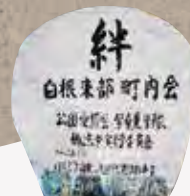
町内会シンボル(大団扇)