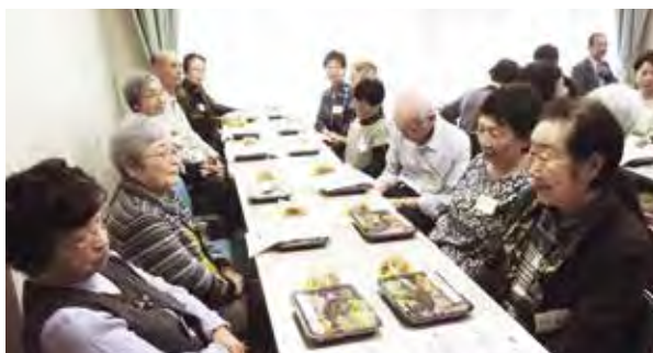
年3回の昼食会を楽しみにしています

珈琲の香りの中で懐かしい名曲を楽しむ「みずき名曲サロン」を定期的で開催するとともに、昼食会を開催しています。引きこもりがちな高齢者に気軽に外出してもらい、皆様が楽しんで交流できる居場所作りに取り組んでいます。また、救急用医療情報キット(マイカプセル)を配布して、いざという時にも備えています。