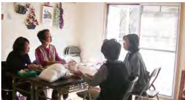
趣味の手作り教室を行っています

団地に住む高齢者がいきいきと暮らし続けられるよう、団地の空き室を改装して作った「まごころの家」を拠点に、様々な交流活動を行い、住民相互のコミュニケーションの活性化を図っています。趣味やおしゃべりをとおした交流のほか、健康セミナーや何でも相談会等を開催し、「健康団地」を推進しています。