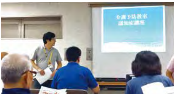
認知症について真剣に学ぶ地域の皆さん

横浜市や旭区の防災計画の見直しに加え福祉避難所など防災への環境整備が一部変化したため、平成27年に作成した「防災マニュアルマップ」を補完し、地域住民へ配布しました。さらに今年度は、認知症の基礎知識について講習会を行い、避難所等での認知症への対応の一助となりました。