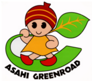
旭区グリーンロードシンボルマーク てっくるちゃん

グリーンロードとは、旭区グリーンロード構想に基づき詳しい現地踏査を行い設定した全体ネットワークの計画路線のことです。