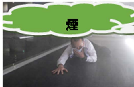
煙が床の近くまで来た場合