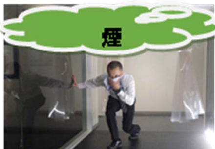
煙が部屋の間中である場合