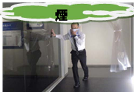
煙が天井付近のみの場合