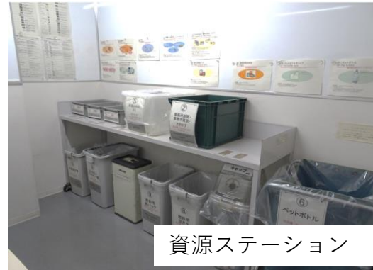
2-2) FY19 GHQ 各フロア活動進捗状況