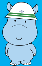
横浜市水環境キャラクター かぼのだいちゃん