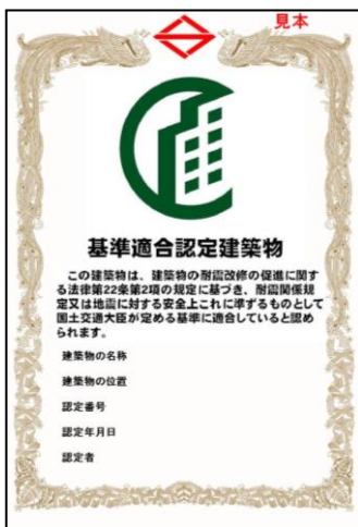
あん震マーク認定証 (A4)