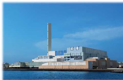
金沢工場（ごみ焼却工場）