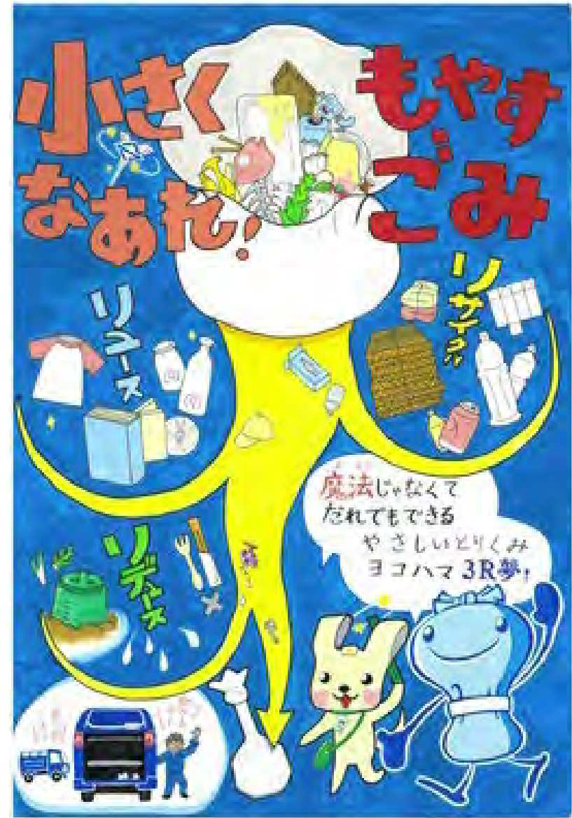
令和5年度 準大賞作品（小学校高学年の部）