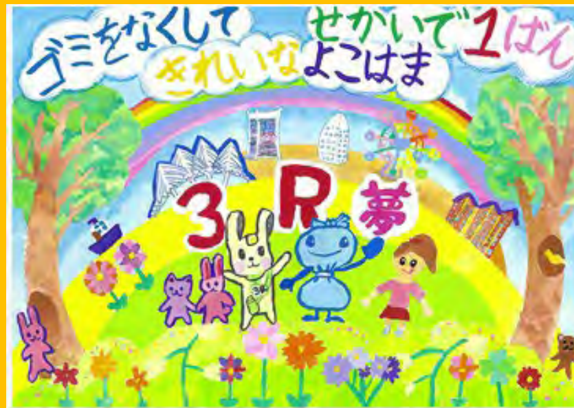
令和5年度 大賞作品（小学校低学年の部）

～横浜の子ども達に環境意識の醸成を目的に開催しております。本コンクールにぜひお力添えいただきたく 御案内申し上げます～