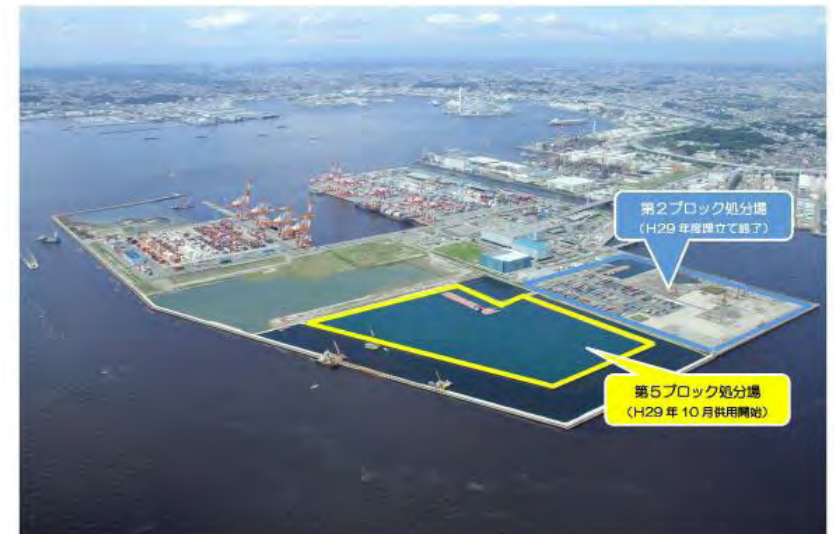
南本牧第5ブロック廃棄物最終処分場