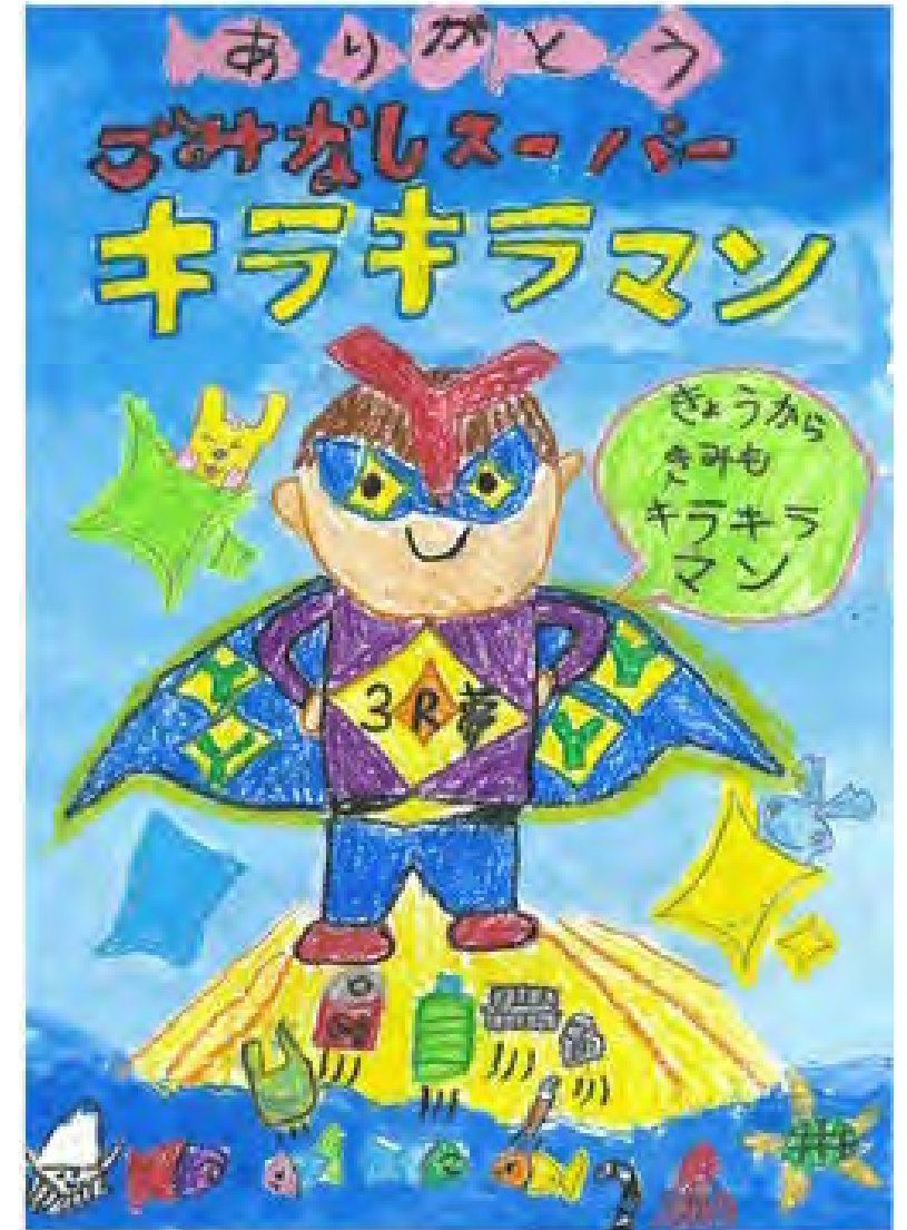
令和5年度 準大賞作品（小学校低学年の部）

広告代理店のほか、協賛企業自らのお申込みも可能です。 お申し込み時に広告主が決定していない場合は、決定後 速やかに広告主審査を受けてください。