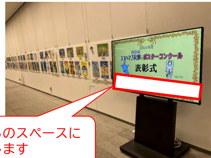
【作品展示イメージ】