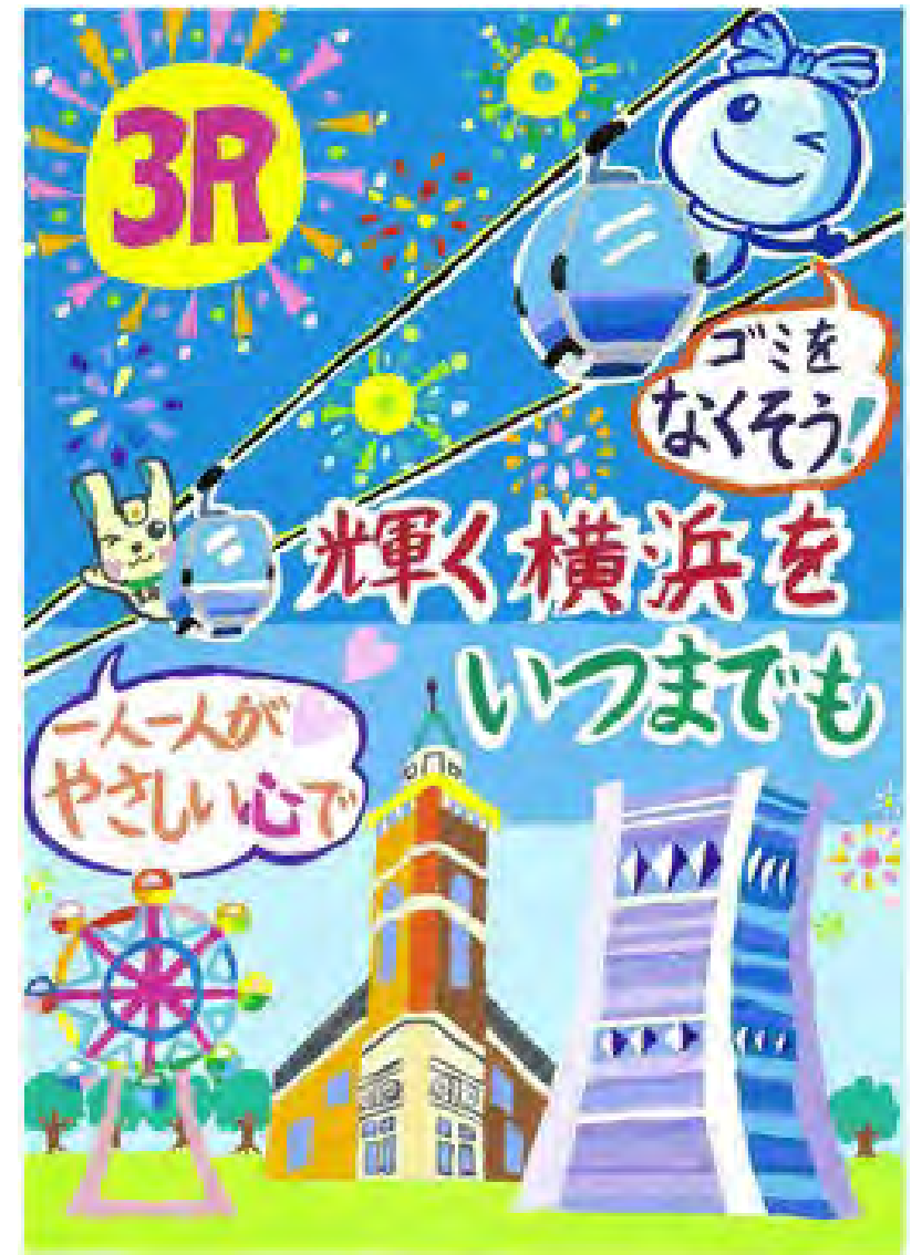
令和5年度 準大賞作品 (小学校高学年の部)

URL https://www.city.yokohama.lg.jp/kurashi/sumaikurashi/gomi-recycle/gakushu/posucon/posucon-gaiyou.html