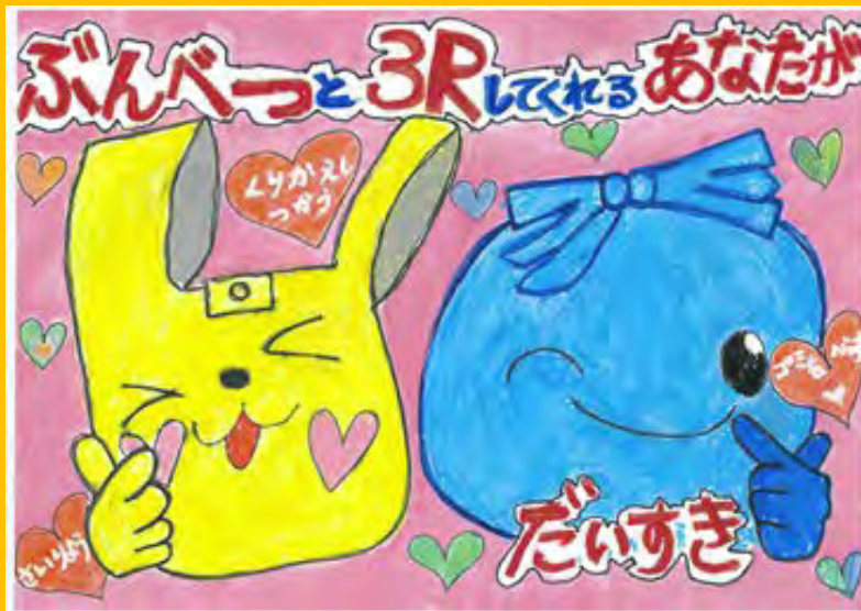
令和5年度 準大賞作品（小学校低学年の部）