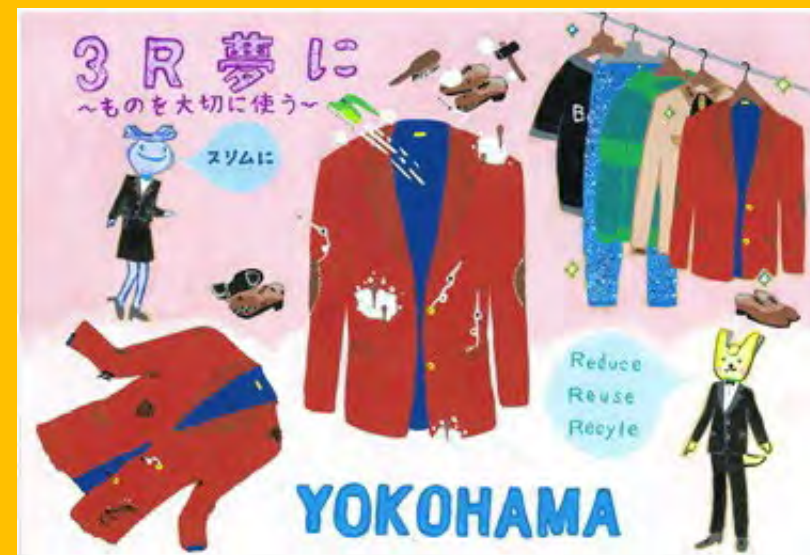
令和5年度 準大賞作品（中学生の部）