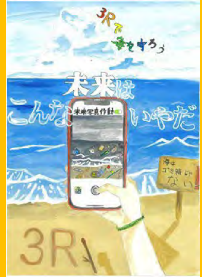
令和5年度 大賞作品（中学生の部）

子どもらしい自由な発想や創造力で環境にやさしい行動を市民の皆様に訴えるポスターを描いてもらい、横浜市の環境施策の広報啓発で活用すること、また、ポスター制作を各学校で授業に取り入れ、夏休みの課題等とすることで、児童・生徒のみなさんがこれらのテーマに向き合い、環境問題に関する基礎的な知識を身につけるとともに、その解決に必要な行動を自らが考え、実践するきっかけとすることを目的としています。