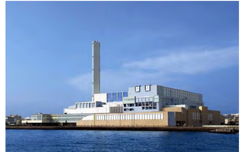
焼却工場（金沢工場）