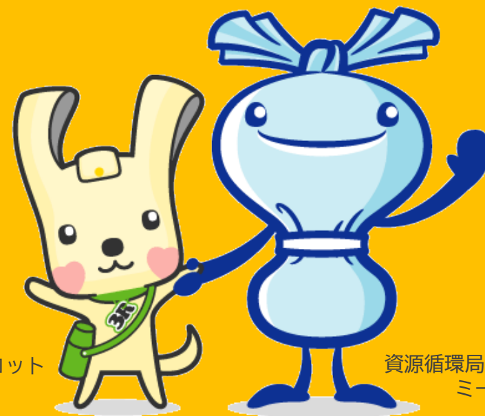
資源循環局マスコット イーオ