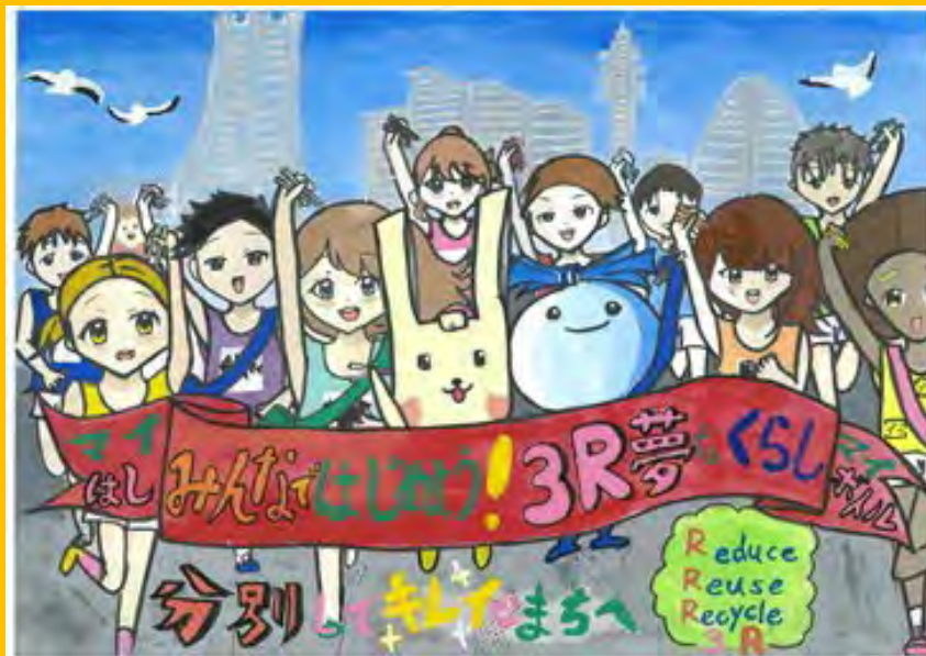
令和5年度 大賞作品 (小学校高学年の部)