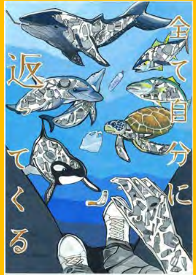
令和5年度 準大賞作品（中学生の部）