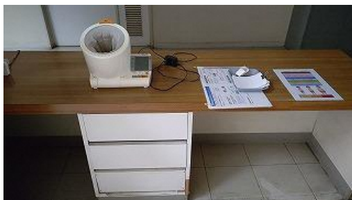
【健康管理コーナー】