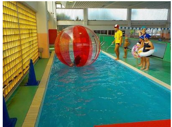
【スポレクイベント】