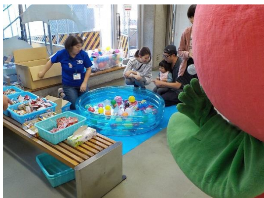
【都筑ふれあいの丘まつり①】