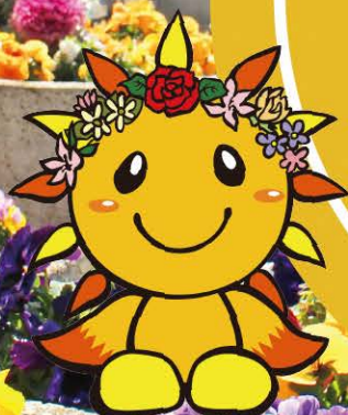
旭区マスコットキャラクター あさひくん

会場情報やマップ、 関連企画を掲載した パンフレットを区役所 や区内 公共施設等で 配布しています！