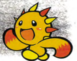
旭区マスコットキャラクター あさひくん

会場 ズーラシア ZOORASIA 申込期間 10月7日(月)～11月8日(金)