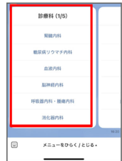
お手持ちの紹介状の宛名を確認・選択