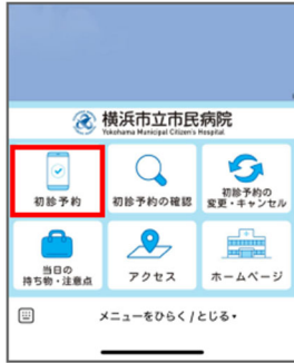
LINE リッチメニューの「初診予約」をタップ

なお、患者さん及び医療機関からの電話による予約方法は継続します。(横浜市電子申請・届出システムによる診療申込は、3月末で終了します。)