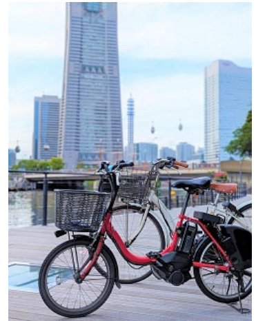
（参考）横浜都心部コミュニティサイクル事業及び 横浜市広域シェアサイクル事業社会実験画像

併せて、公募条件について、シェアサイクル事業者の皆様との「対話」（サウンディング調査）を実施します。