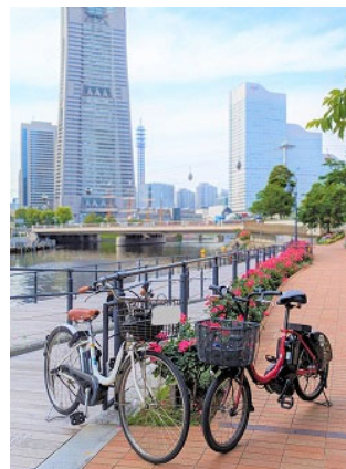
（参考）横浜都心部コミュニティサイクル事業及び 横浜市広域シェアサイクル事業社会実験画像

提出先アドレス：do-sharecycle@city.yokohama.lg.jp