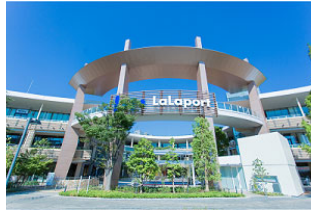
三井ショッピングパーク ららぽーと横浜