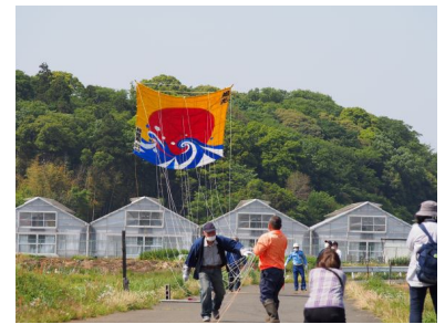
《令和4年度の凧揚げ会の様子》