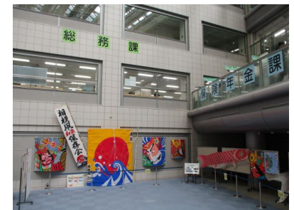
《令和4年度区民ホール展示の様子》