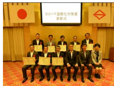
【参考：昨年度表彰式の様子】

オルトヨコハマビジネスセンター管理組合 JFE エンジニアリング株式会社 生活協同組合ユーコープ 株式会社そごう・西武 東亜合成株式会社 株式会社ニチレイ・ロジスティクス関東 日揮ホールディングス株式会社 株式会社みずほ銀行 三菱地所株式会社 株式会社武蔵野