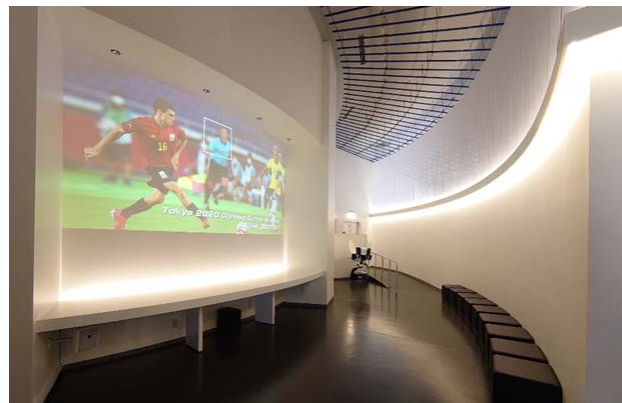
音と映像で、大会時の盛況を体感！