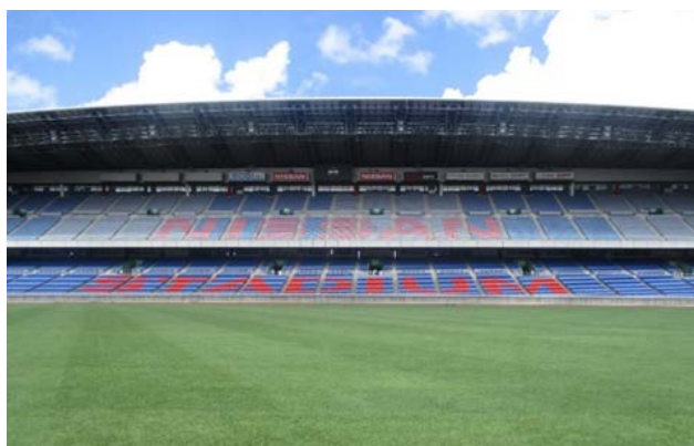
普段は入れないフィールドを選手目線で体感！