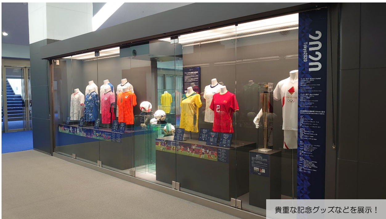
貴重な記念グッズなどを展示！