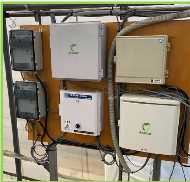
導入予定のスマート農業機器