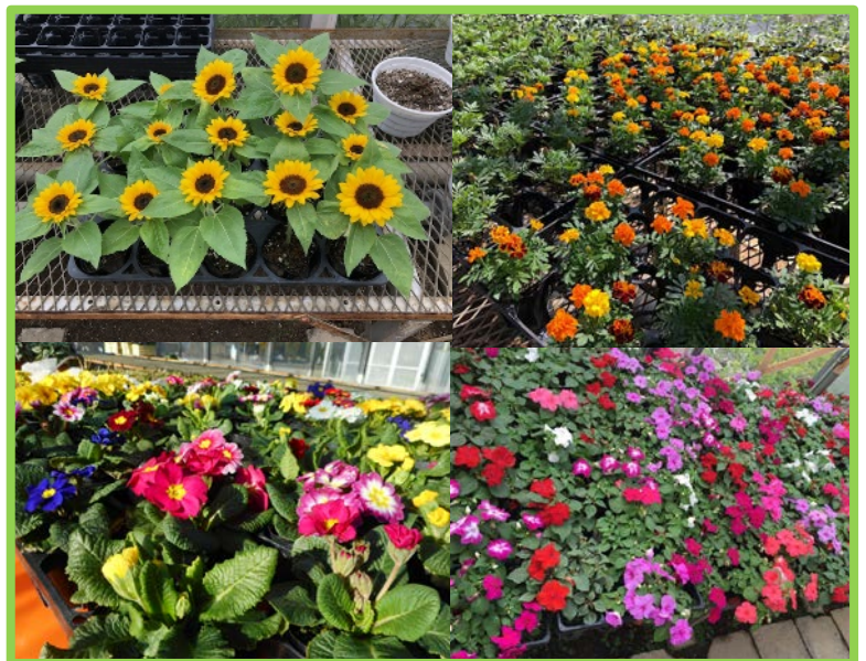
栽培作物イメージ