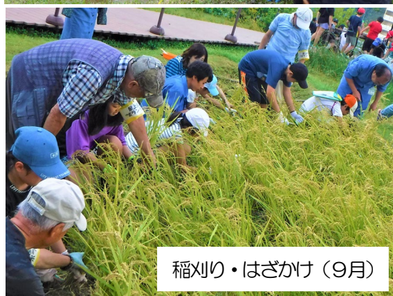
稲刈り・はざかけ（9月）