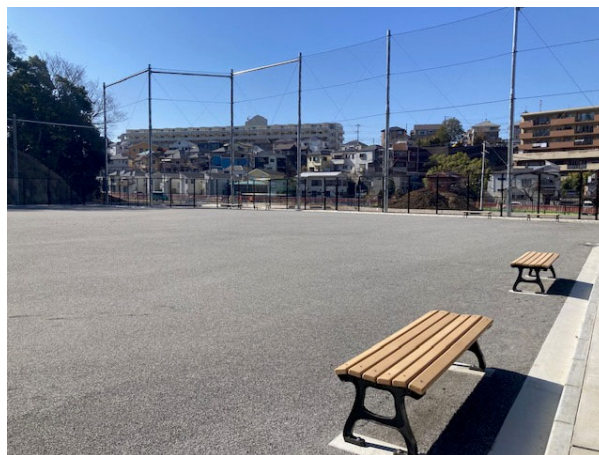
打越広場（多目的広場）現況（令和6年2月撮影）