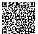
こども『エコ活。』 大作戦！2023 HP