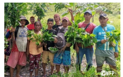
フィリピン・ミンダナオ島での植樹の様子