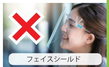
フェイスシールド