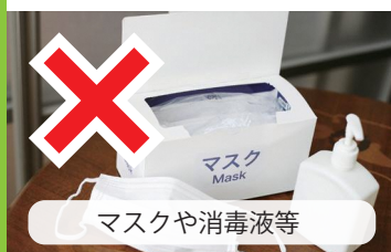
マスクや消毒液等