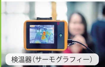
検温器(サーモグラフィー)