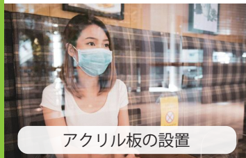
アクリル板の設置