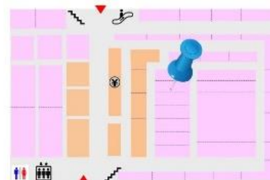
イラストマップイメージ