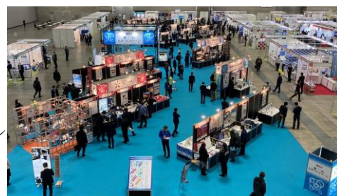
「テクニカルショウヨコハマ 2022」の様子