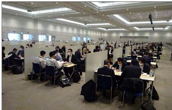
令和5年度に実施した「九都県市合同商談会2024」の商談風景 (会場:パシフィコ横浜 アネックスホール)

首都圏産業の国際競争力の強化を図るため、平成20年度から九都県市(埼玉県、千葉県、東京都、神奈川県、横浜市、川崎市、千葉市、さいたま市、相模原市)が連携して合同商談会を開催し、今回で第17回目を迎えます。