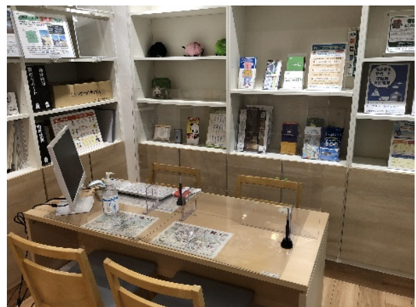
京急すまいるステーション 金沢文庫駅相談カウンター 内観