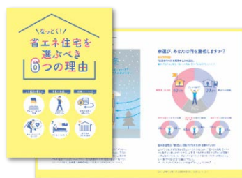
省エネ住宅化リーフレット