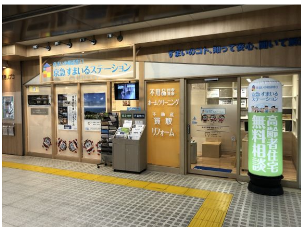
京急すまいるステーション 金沢文庫駅相談カウンター 外観