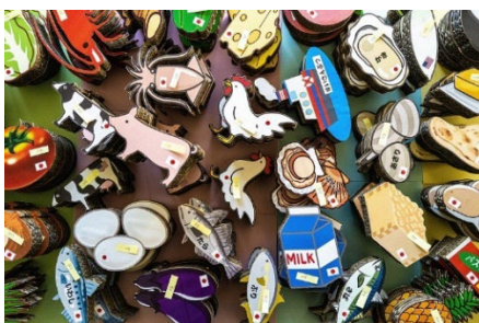
▲レシピづくりゲームに使用する食材ブロック