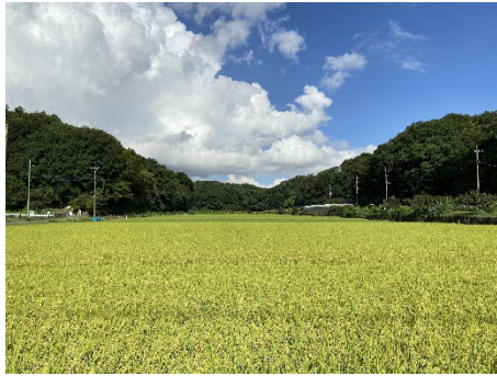
▲寺家に広がる田園風景