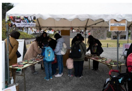
▲こどもの国で行われたワークショップの様子