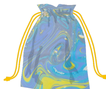
▲巾着製作イメージ

※この他、横浜市による脱炭素化の推進に向けた活動・取組のパネル展示などを予定しています。