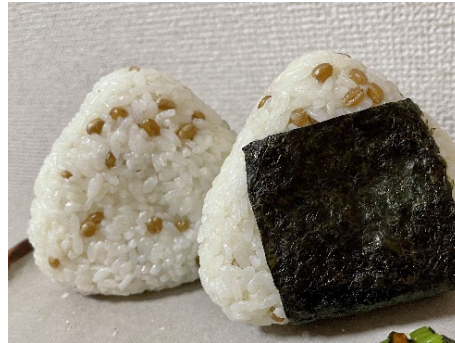
▲おにぎりのイメージ