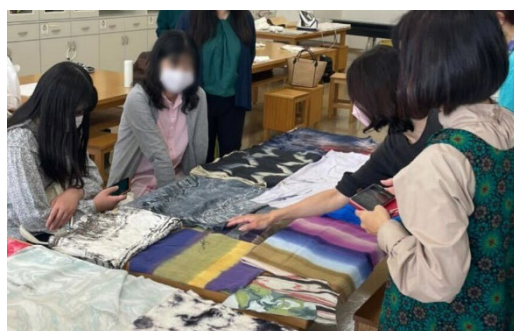
▲ワークショップの様子