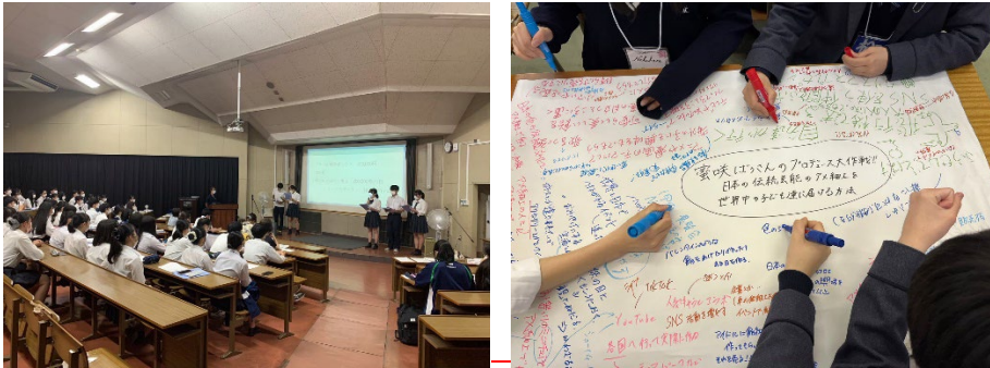
▲アントレプレナーシップ授業の様子