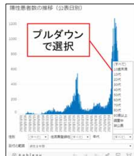
陽性者数の推移グラフイメージ

性別・住民登録地・年代のボックスがあり、プルダウンで選択するとグラフが切り替わります。