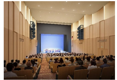
港北区民文化センターイメージ

皆様からより愛着を持たれる施設となるよう、今年初めに行った愛称募集では、151作品ものご応募をいただきました。厳正な審査により4作品の最終候補が決定し、その中から区民の皆様のご投票で、最も得票数の多い作品を、港北区民文化センターの愛称として決定します。