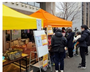
こども防災フェアの様子 （令和7年3月8日）

いつ起こってもおかしくない災害に備え、地域の皆さまの安心・安全や住みやすい街を実現するため、防災を中心とした取組を協力して継続・発展させる必要性を両者が確認し、協定を締結することとしました。