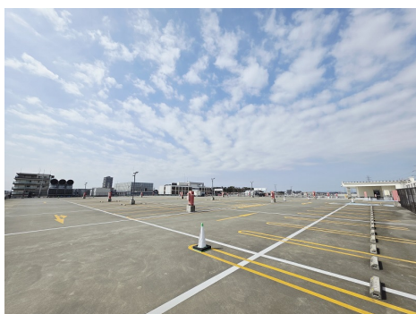
アピタテラス横浜綱島 屋上駐車場