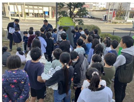
Tsunashima SST 内で行っている 近隣小学校児童への防災啓発