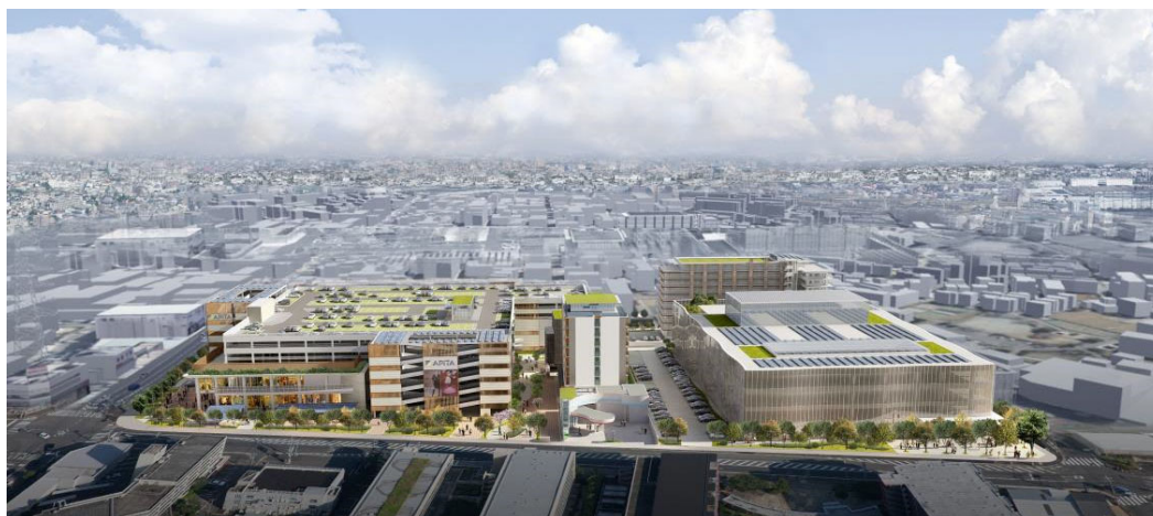
Tsunashima サスティナブル・スマートタウン 全景