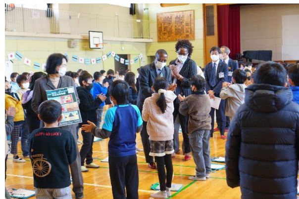
ボツワナ大使による小学校訪問