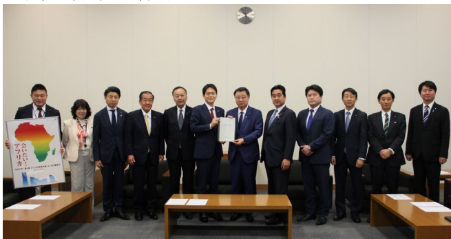
左から：草間議員(市会)、阿部議員(衆)、青柳議員(衆)、佐藤議員(市会)、島村議員(参)、山中市長、松野官房長官、坂井議員(衆)、山本議員(衆)、古川議員(衆)、山崎議員(衆)、鈴木(敦)議員(衆)