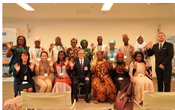
日アフリカビジネスウーマン交流プログラム