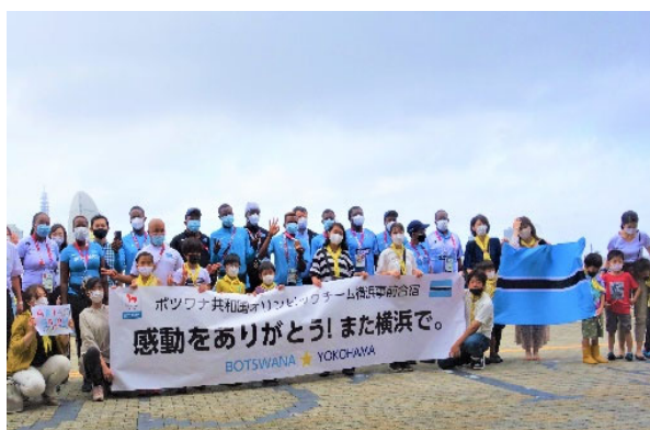
ボツワナオリンピックとの交流