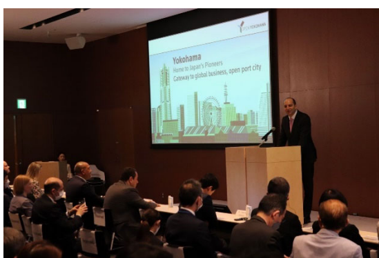
チュニジア大使によるビジネスセミナーでの講演