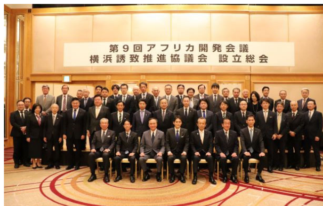
第9回アフリカ開発会議横浜誘致推進協議会設立総会 (令和5年4月24日)