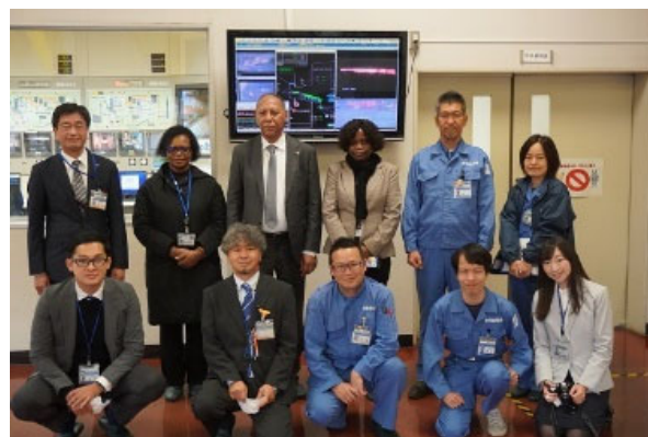
アンゴラ大使による清掃工場視察