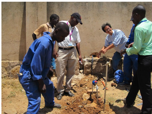
マラウイにおける水道分野での技術協力