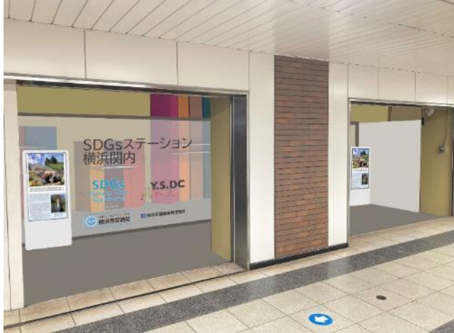
「SDGs ステーション横浜関内」イメージ