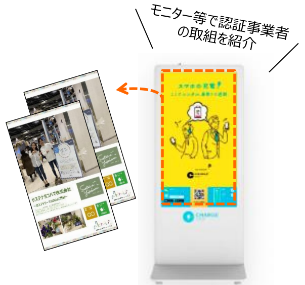
シェアリングサービス [ChargeSPOT] + 認証事業者の取組紹介 イメージ