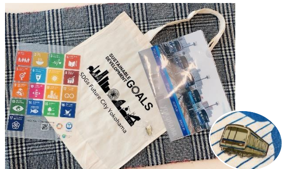
先着プレゼント(イメージ)

オープニングイベントとして、“SDGs 未来都市・横浜 オリジナルエコバッグ”に車両ピンバッジなど市営交通グッズ等を詰め合わせた特別セットを、「SDGs ステーション横浜関内」にご来場の方 先着 100名様 にプレゼントします。