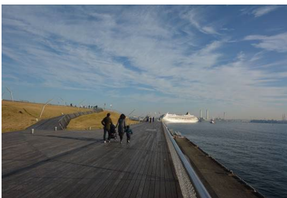
横浜港振興協会会長賞 <大さん橋>