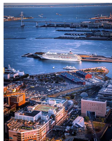
佳作 <飛鳥のいる街>