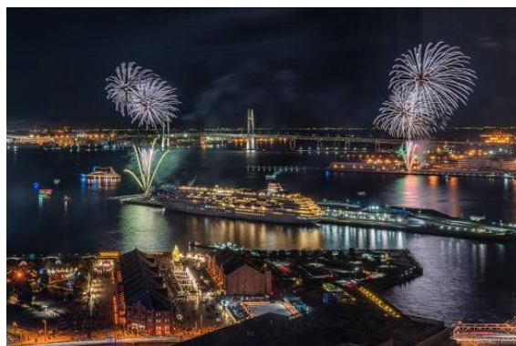
準特選 <栈橋に咲く花>