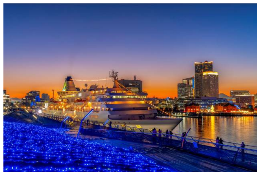
特選 <最後の航海～ぱしふいっく びいなす～>