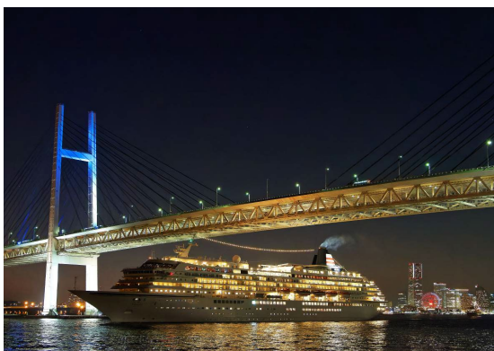
横浜市港湾局長賞 <いざ出港>