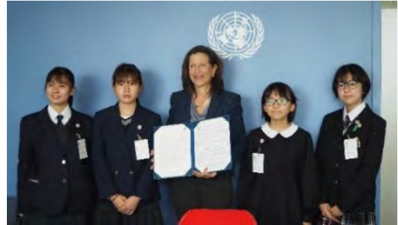
ニューヨークの国際連合本部にて、国連事務総長あて市長メッセージを手渡す様子(令和4年度 国際連合事務次長を表敬訪問)