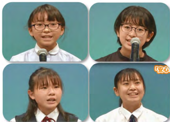
令和4年度 よこはま子ども国際平和スピーチコンテスト ～本選の様子～