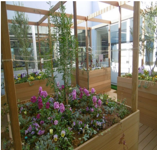
オープンした「ミドリン GARDEN」