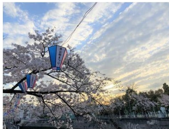
雨あがりのソメイヨシノとぼんぼり (清水橋付近)

朝から続いた雨も上がり夕日が顔を出す大岡川プロムナード。 ソメイヨシノも満開で、屋台や花見客でにぎわっていました。