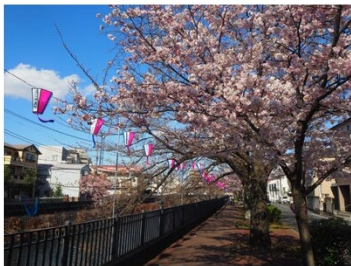
大井橋付近の様子

ソメイヨシノのつぼみが色づいてきました。 南区制80周年記念みなみ桜まつりに向け、ぼんぼりの準備が進んでいます。