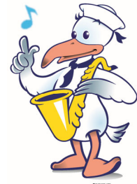
中区のマスコットキャラクター 「スウィングー」