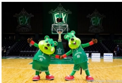
B3リーグ横浜エクセレンス 2023年4月1日・2日 1階指定席ペアチケット (各日10組20名様)