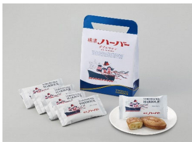
株式会社ありあけ 横浜ハーバーダブルマロン5個入り (10名様)