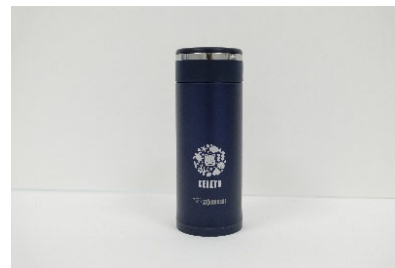
京浜急行電鉄株式会社 京急オリジナルステンレスポトル (5名様)