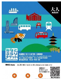
横浜市交通局 みなとぶらりチケット (10名様)