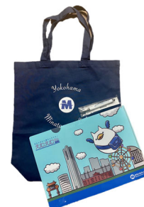
横浜高速鉄道株式会社 みなとみらい線オリジナルグッズ セット (10名様)