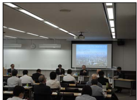
「大都市制度シンポジウムin関東学院大学」の開催