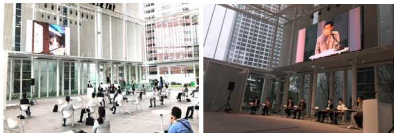
《市庁舎アトリウムでの共創オープンフォーラム開催の様子（9/24 開催）》