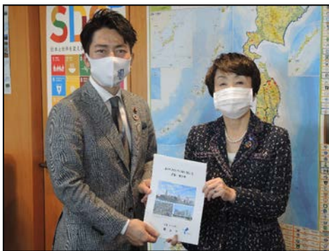
小泉 進次郎 環境大臣へ提案