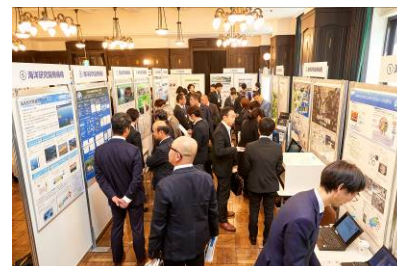
《左・中：「海洋都市横浜うみ博（うみ博）」の様子 右：「海と産業革新コンベンション（うみコン）」の様子》