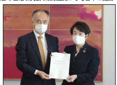
「第3次 横浜市大都市自治研究会 答申」手交式