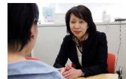
キャリアカウンセリングの様子