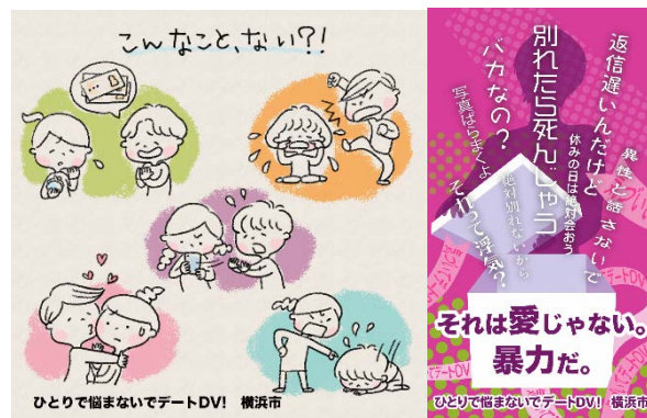
SNSを活用したデートDV防止啓発