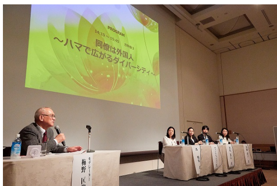
横浜女性ネットワーク会議