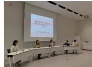
技術職場で活躍する女性との交流イベント