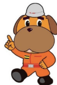
横浜市消防局マスコット キャラクターハマくん