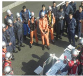
※以前の訓練の様子