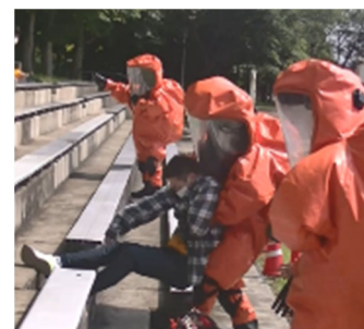
※以前の訓練の様子

横浜市消防局 指揮隊、指揮支援隊、特別高度救助部隊、特殊災害対応隊、特別救助隊、大型除染隊、大型除染支援隊、消防隊、救急隊 (計25隊100人)