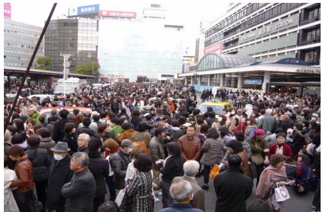
平成23年3月11日東日本大震災時の横浜駅周辺の様子