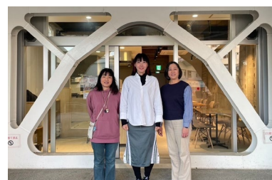
提案メンバーであり、【結び手】でもあるシェアベースを大きく支える3人

『食を通して何かをやりたい』『まだやりたいことは分からない…』そんな人を見守り、おせっかいをし、そして寄り添います。この場所で、たくさんの人の少しの力を合わせて「できたらいいよね」を「できるかもしれない」、そして「できた！」に繋げていくことを目指しています。