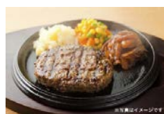
ステーキ&ハンバーグ ハングリータイガー 寄附額 27,000円