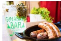
大葉ピクルス&大葉ソーセージ ホイザー 寄附額 22,000円