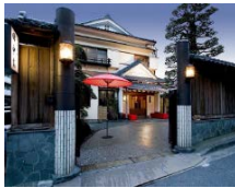
老舗料亭お食事券 田中家 寄附額 200,000円