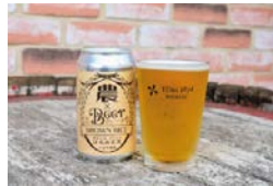
農×Beer 坂口屋 寄附額 18,000円