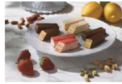
フランセミルフィユ シュクレイ 寄附額 15,000円