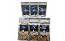
パーミルロケット&ナッツ 下平製作所 寄附額 20,000円