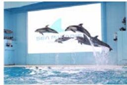
ワンデーパス引換券 横浜・八景島シーパラダイス 寄附額 32,000円