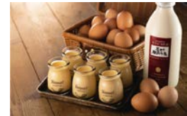
手作りプリン POZDINING 寄附額 13,000円