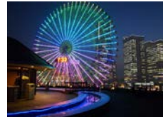
入館券 横浜みなとみらい万葉倶楽部 寄附額 18,000円