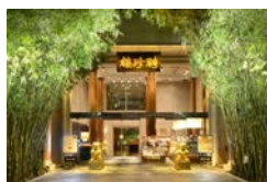
コースお食事券 聘珍樓 寄附額 95,000円