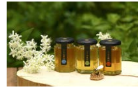
大倉山はちみつ 大倉山ミエル 寄附額 20,000円