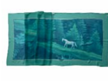
東山魁夷シルクストール ヤエザワ 寄附額 100,000円