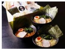
家系らーめん 吉八家 エイト 寄附額 12,000円