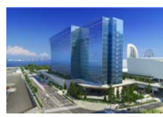
ペア宿泊券 ザ・カハラ・ホテル&リゾート 横浜 寄附額 450,000円