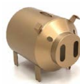
蚊取り線香ホルダー ふた 羽咋工業 寄附額 21,000円