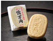
億万両もなか 億万両本舗和作 寄附額 13,000円