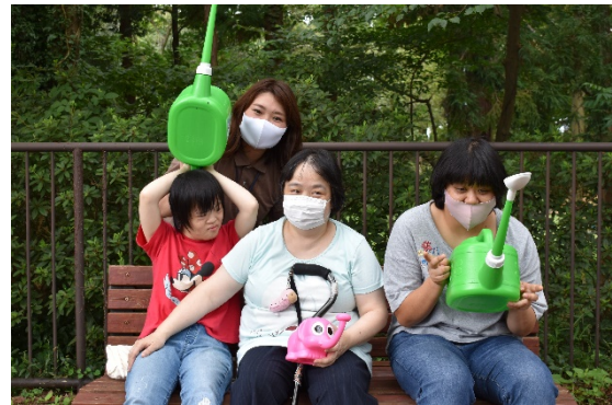
「障害者地域活動ホームあさひ」の皆さん