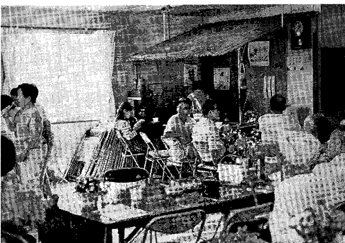
ふれあいセンター（西神第7仮設ふれあい喫茶）