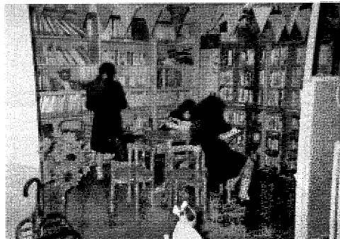
■横浜AIDS市民活動センター（図書コーナー）